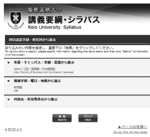
スマートフォン向けサイト