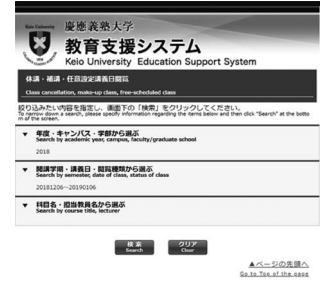
スマートフォン向けサイト