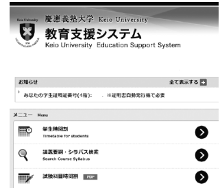
スマートフォン向けサイト