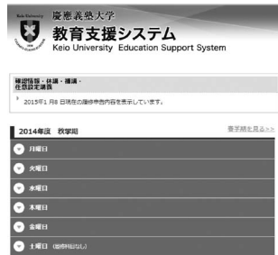
スマートフォン向けサイト