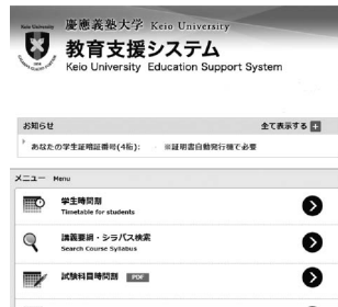
スマートフォン向けサイト