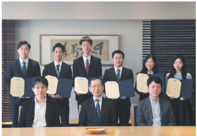
写真：修了式出席者のみ掲載

Those students who successfully complete two semesters of the GPP, by accruing 8 credits from 4 different classes in addition to participating in two workshops worth 8 credits, will receive a certificate of completion from the President of Keio University and the Dean of the Faculty of Business and Commerce. Since it is possible to complete the program during the 3rd year of a student's college career, the certification will likely help in the job hunting process. Additionally, since students will be recognized as a participant in an Honors Program, they will surely be at an advantage when applying to either a domestic or international graduate studies program. Furthermore, students can begin the program not only in the Spring of their 3rd year, but also in the Fall of their 3rd year or Spring of their 4th year, thus allowing many to have the opportunity to receive certification in the program. Finally, it is worth noting that students do not have to enroll in the program over consecutive semesters.