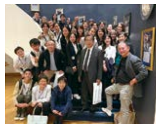
2023年度海外研修 with SF三田会メンバー