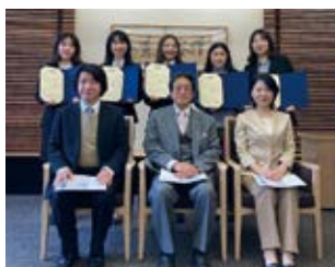
2022年度修了式 出席者のみ掲載

Those students who successfully complete two semesters of the GPP, having earned 8 credits from 4 different courses and another 8 credits from participation in two GPP workshops, will receive a certificate of completion from the President of Keio University and the Dean of the Faculty of Business and Commerce. Since it is possible to complete the program during the 3rd year of a student's college career, the certification will likely help in the job-hunting process. Additionally, since students will be recognized as participants in an honors program, it will likely be an advantage when applying to either a domestic or international graduate studies program. Students can start their program as best suits their individual career at Keio, beginning in the Spring of their 3rd year, the Fall of their 3rd year, or even the Spring of their 4th year. Students may choose to enroll in the GPP in non-consecutive semesters, thus allowing even greater flexibility.